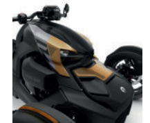
Fiebre del oro